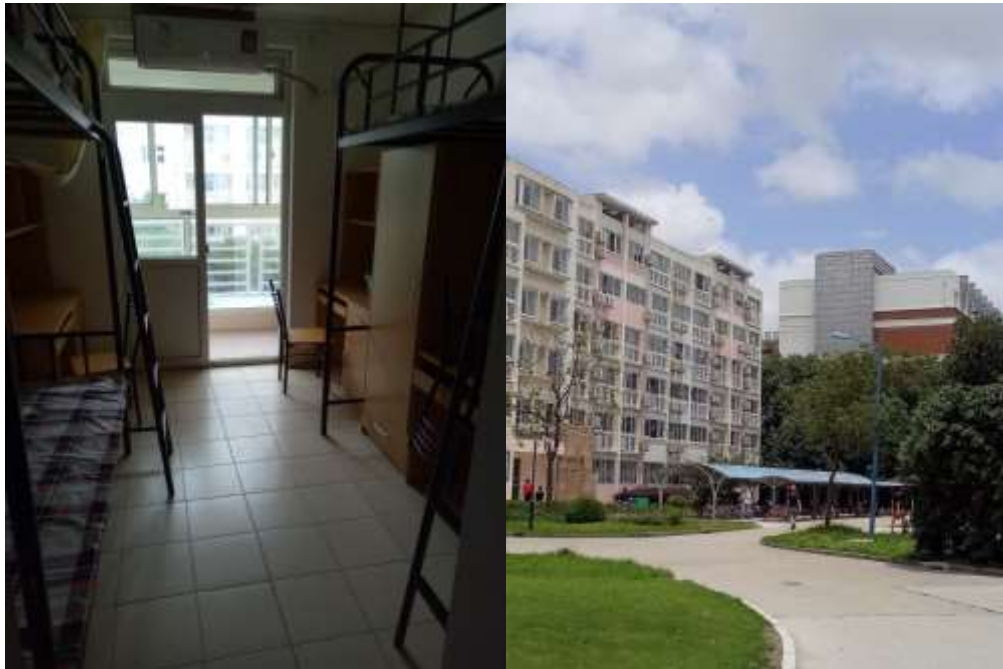
東 32 宿舍與 301 號房

這次學校分配我們住在東 32 及東 33 宿舍，進入宿舍會有阿姨登記入住及報到，需交給阿姨 5RMB 作為鑰匙押金，最後退宿時只要交還鑰匙就會退還，另外還有冷氣遙控器及蚊帳，宿舍為三人一房，每人有一張書桌一張床一個衣櫃並共用廁所及陽台，房間雖然不大但卻很窩心，我們早上都會在陽台的洗手台刷牙化妝曬太陽，晚上雖然聚在一起的時間不長卻總是寒暄個幾句聊聊今天的生活和報告的煩惱，我想最讓我們倒吸一口氣的就是廁所的蹲式馬桶，廁所屬於比較不通風型，所以我們都會適時的開一點小縫通風，並特別買了馬桶刷及清潔劑來維持廁所乾淨，但一段時間也就習慣了，另外大家最無法習慣的還是那硬到不行的木板床，學校提供的是很薄的床墊但是枕頭和棉被都是不錯的，如果真的睡不了硬木板床的人可以帶個床墊或是買個床墊會差很多，我個人後來覺得木板床的好處是讓自己不會想一直賴床，反而是鬧鐘一響就會自然而然起床了，也算是另類的小收穫！