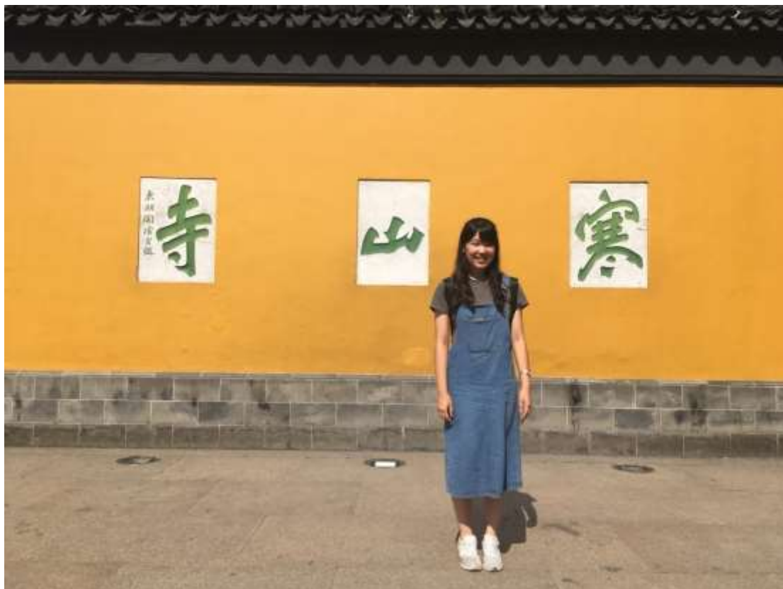
20180727 蘇州行—姑蘇城外寒山寺 夜半鐘聲到客船